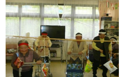
種目：パン食い競争