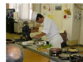
● お昼はお寿司でした