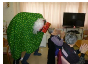
● おめでたいという事で獅子舞が登場です。