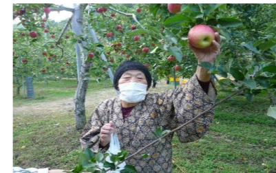
● 利根町でリンゴ狩り