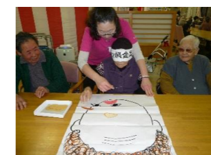
● 新年会のゲームは福笑いや羽根つきを行い、楽しみました