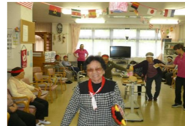
種目：借り物競争の様子