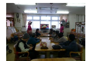
● ビンゴゲームを開催