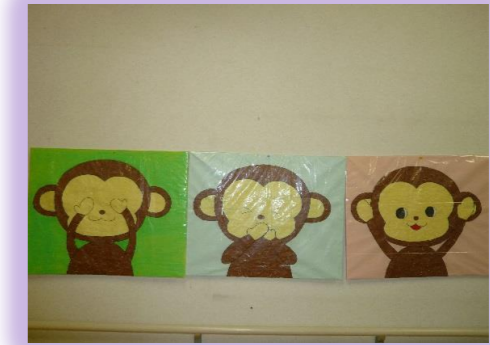
デイの出展作品のはり絵