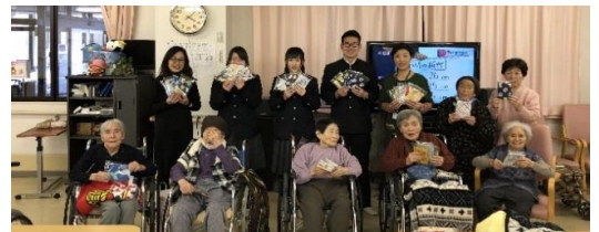
尾瀬高校様 巾着袋