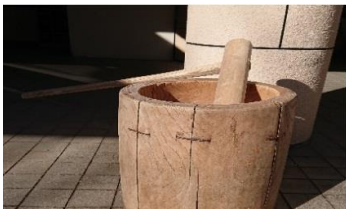
武尊観光開発株式会社 様